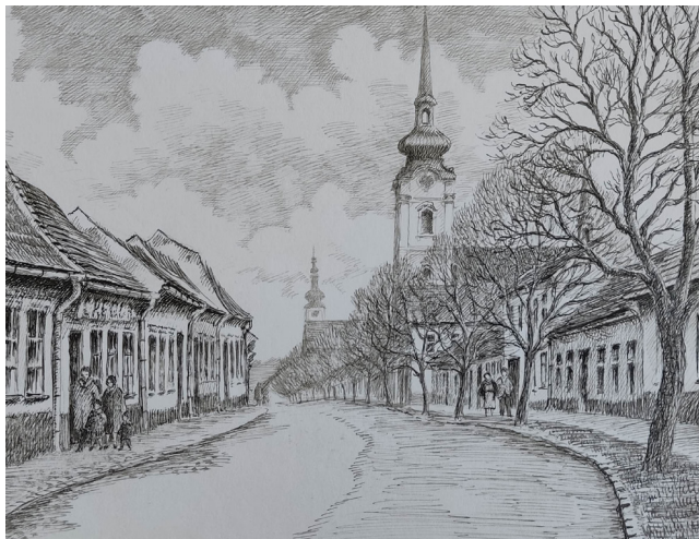
ZDENĚK HORÁK Vzpomínky na Prostějov

12. 7 - 15. 9. 2024 Vernisáž 11. 7. 2024